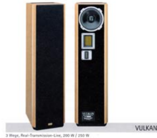
3 Wege, Real-Transmission-Line, 200 W / 150 W