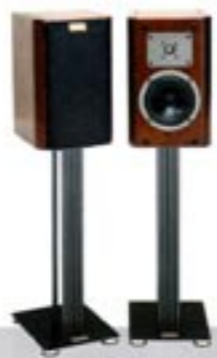
2 Wege, Baßreflex, 50 W / 80 W PICO

Zierlich sind die kleinen Regallautsprecher PICO und IPSO. Doch werden Sie ihre geringen Abmessungen beim klanglichen Auftritt vergessen. Die beiden Lautsprecher loten die physikalischen Grenzen kleiner Kompaktgehäuse aus und demonstrieren, welche Transparenz und Stimmigkeit sich selbst bei geringem Volumen verwirklichen lassen.