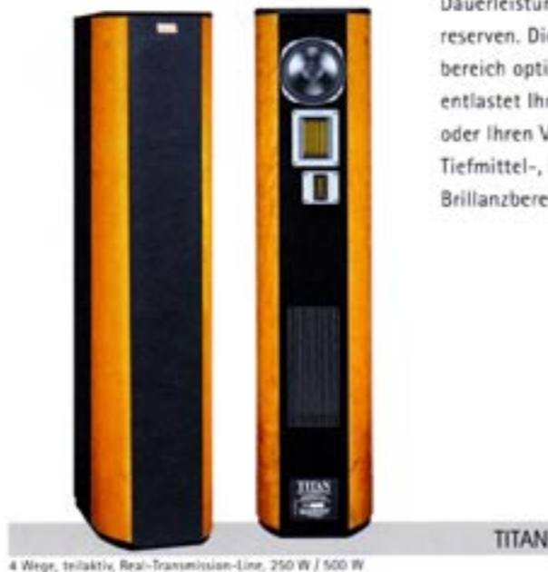
4 Wege, teilaktiv, Real-Transmission-Line, 250 W / 500 W

Das offene System der einmal gefalteten Laufzeitleitung (Real Transmission Line) erlaubt eine immense Baßdynamik, die verbunden ist mit einem beispiellosen Tiefgang, der durch Bedämpfung des Leitungsweges erreicht wird.