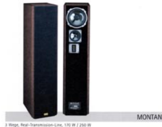
3 Wege, Real-Transmission-Line, 170 W / 250 W