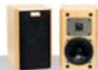
2 Wege, Baßreflex, 50 W / 80 W IPSO

Die als Zubehör erhältlichen Designstative machen aus den Regallautsprechern PICO und IPSO ansprechende kleine Standlautsprecher.