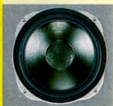
TITAN MK I: REFERENZ (Stereoplay 12/81)

1981 stellte quadral einen Lautsprecher der Spitzenklasse vor, der zur Legende wurde und bis heute unvergessen ist: die quadral Phonologue TITAN. Zahlreiche Testsiege in renommierten deutschen und internationalen Fachzeitschriften dokumentieren die herausragende Klasse dieses High-End-Lautsprechers. Von 1981 bis 1989 war die TITAN in ihren drei Entwicklungsstufen ununterbrochen Referenz für Passivlautsprecher bei der Fachzeitschrift Stereoplay, bis 1992 in ihrer vorerst letzten Entwicklungsstufe (MK IV) bei HiFi-Vision. Die TITAN avancierte in anderthalb Jahrzehnten zu einem Klassiker der vollendeten Musikwiedergabe, an dem sich die gesamte HiFi-Fachwelt orientierte und noch orientiert. Mit der quadral TITAN wurde und wird Musik nicht gehört – sie wird erlebt.