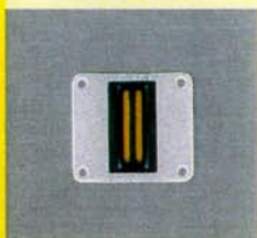
TITAN MK III: absolute Spitzenklasse, REFERENZ (Stereoplay 2/87)