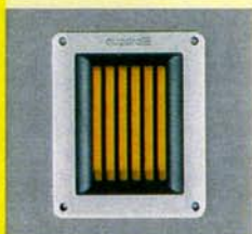
TITAN MK II: absolute Spitzenklasse, REFERENZ (Stereoplay 11/83)