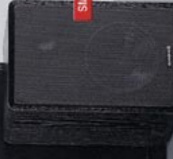
SM 90 II