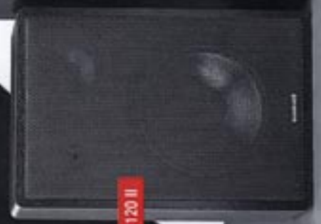
SM 120 II