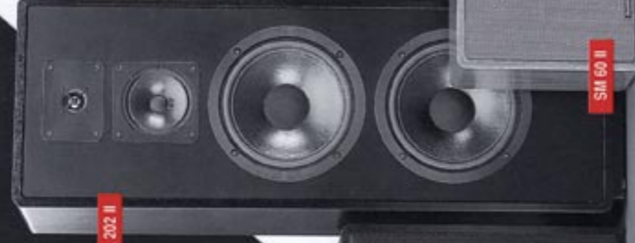
SL 202 II