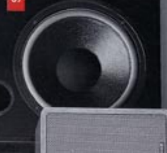
SM 150 II