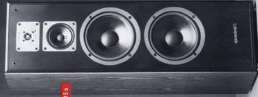
quintas 215 s