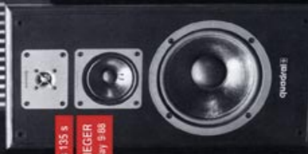
quintas 135 s