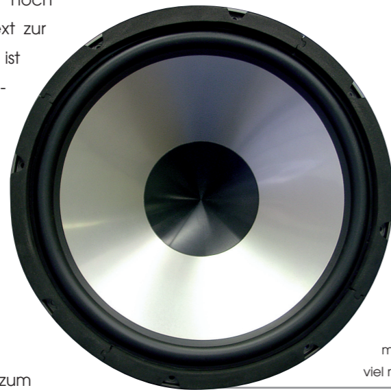
Stichpunkte zum 15" Tieftöner, einige Besonderheiten. max. 3-5 Zeilen wenn möglich nicht viel mehr.