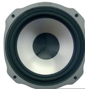
Stichpunkte zum Mitteltöner, einige Besonderheiten. max. 3-5 Zeilen wenn möglich