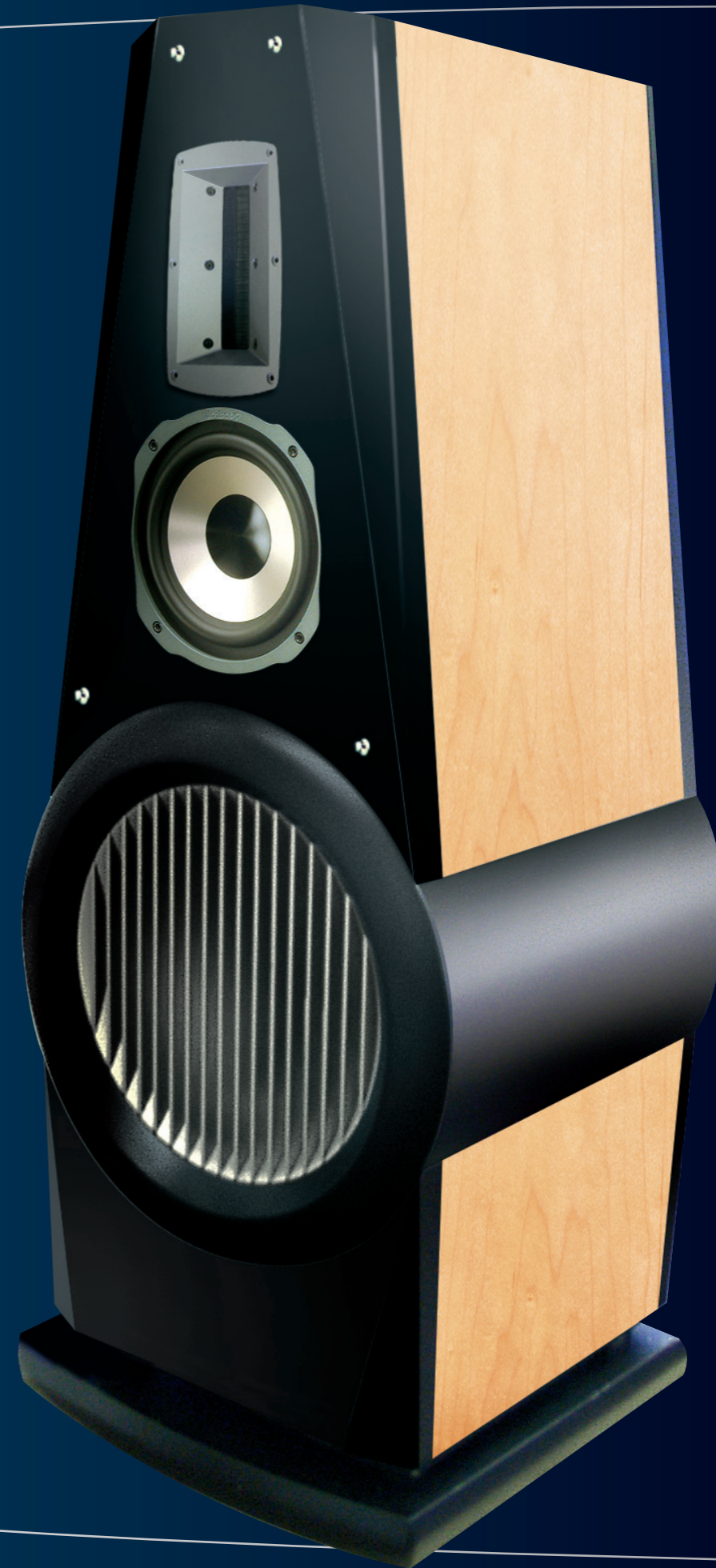
Große Abbildung der TITAN mit gestaltetem Hintergrund, leicht gedreht. Im Hintergrund eine Rückansicht mit Terminal und Fenster.