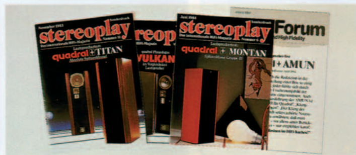
Diese Testberichte sollten Sie unbedingt anfordern.

Produkt: Die gute Industrieform 1982: Die VULKAN wird von einer internationalen Jury mit dem Designpreis „ Die gute Industrieform “, if 82, ausgezeichnet.