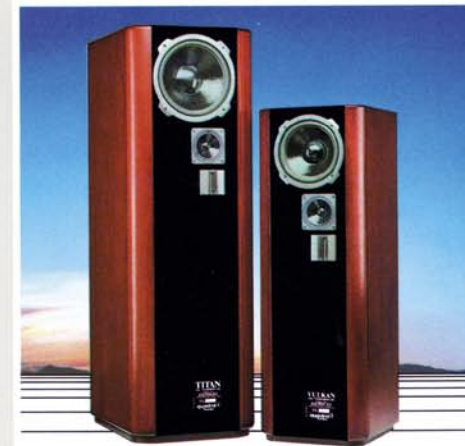
Die sanfte Revolution von quadral.

Und dann ist es soweit, auch ein Spitzenlautsprecher wie die TITAN , die ja das Konstruktionsvorbild für die gesamte Phonologue-Serie darstellt, partizipiert an dem gesammelten know how. Die Elektromechanik, das verwendete Material, die handwerkliche Perfektion in der Fertigung, Meßverfahren und die Umsetzung neu gewonnener Erkenntnisse insgesamt, sorgen für ein Höchstmaß an differenzierter Präzision. So kommt schließlich der mit viel Spannung und Vorfreude erwartete Zeitpunkt, der die Vorstellung einer neuen TITAN erfordert, weil das Maß der inzwischen herangereiften Verbesserungen dies rechtfertigt.